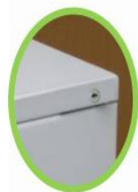
Detalle de Cerradura