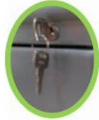
Detalle de llave y Cerradura

Importado de 3 gavetas, con ruedas, color Plateado Med: 22" x 17" x 26", viene con llave y cerradura, Garantía de dos (2) años sobre defectos de fabricación. Cod.:17117