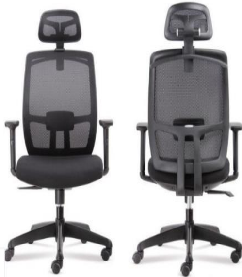
Vista posterior del sillón