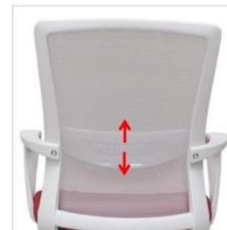
Soporte lumbar regulable