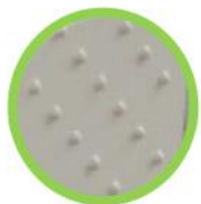
Frente metalico Diseño embosado