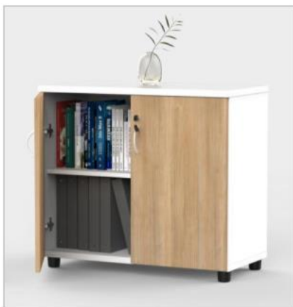
Credenza natural cherry-blanco Puertas batientes color natural cherry, Línea Edza de Formcase, con medidas de: 16" x 32" x 29", con 2 espacios y 1 divison, Garantía de un (1) año Código: 39576