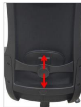
Soporte lumbar ajustable