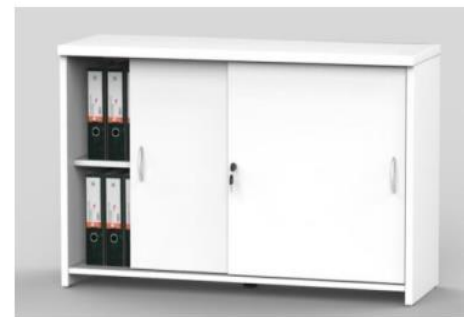
Credenza Edza Blanco De 2 puertas corredizas, color blanco completa, Línea Edza de Formcase, Garantía de un (1) año sobre defectos de fabricación Med: 16" x 48" x 29" Código: 39570